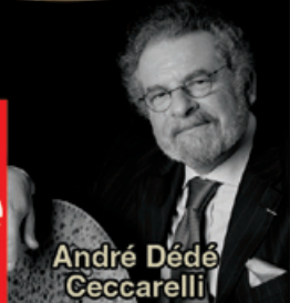
André Dédé Ceccarelli